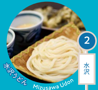
水沢うどん Mizusawa Udon