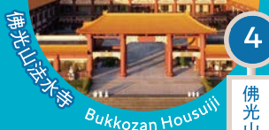
佛光山法水寺 Bukkozan Housuiji